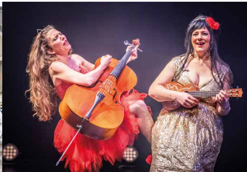
Zique à Tout Bout d'Champ